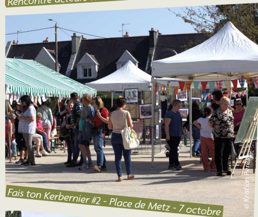
Fais ton Kerbernier #2 - Place de Metz - 7 octobre