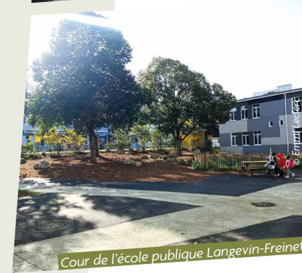
Cour de l'école publique Langevin-Freinet

Les élèves sont aussi lauréats de la saison 3 du budget participatif avec un projet de « parvis piéton pour l'école » mis en œuvre progressivement tout au long de l'année : fermeture de la rue à la circulation automobile, plantations d'arbres dans les espaces verts existants, marquages au sol et enfin travaux de végétalisation de la rue.