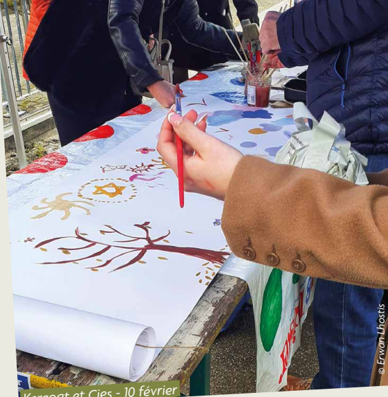
Kergoat et Cies - 10 février

Tout l'été, les structures et partenaires du quartier ont proposé aux habitantes et aux habitants un programme d'activités et d'animations à différents endroits du quartier (sport sur les rives de Penfeld, animations telle la Block Party sur le parvis de la patinoire, bibliothèque de rue au jardin Gagarine), sans oublier les vendredis de l'été proposés par le collectif des MaMaNs 29.