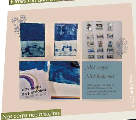
Nos corps nos histoires