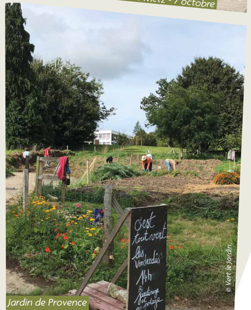
Jardin de Provence