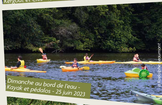
Dimanche au bord de l'eau - Kayak et pédalos - 25 juin 2023