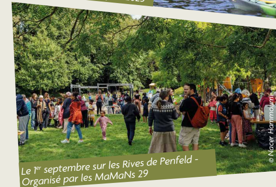
Le 1 er septembre sur les Rives de Penfeld - Organisé par les MaMaNs 29