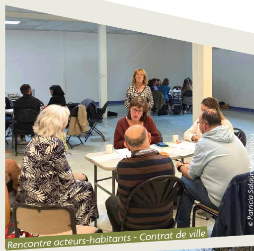
Rencontre acteurs-habitants - Contrat de ville

*Constitué pour organiser les principales animations du quartier, comme Le Dimanche au bord de l'eau depuis 2013 et Noël casse la baraque depuis 2015, Bellevue Animation regroupe la Maison de quartier de Bellevue-Kerinou, le Centre social et culturel de Bellevue, le Patronage laïque du Bergot, les associations du quartier de Bellevue, le conseil participatif de quartier, ainsi que la ville de Brest qui apporte son soutien technique et financier à la mise en œuvre de ces projets.