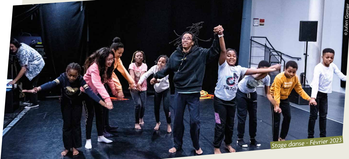
Stage danse - Février 2023