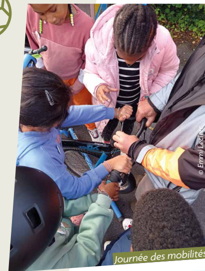
Journée des mobilités

Le 4 octobre, à Toulic ar ran (« le trou »), a été organisée avec les partenaires du quartier (équipements, écoles, associations), une journée autour des mobilités. La matinée était dédiée aux écoles. Durant l'après-midi, des parcours vélos enfants, des essais de vélos électriques, un atelier de réparation de vélos ont été proposés au grand public. Une trentaine de vélos à bas coût a été distribuée à des enfants du quartier.