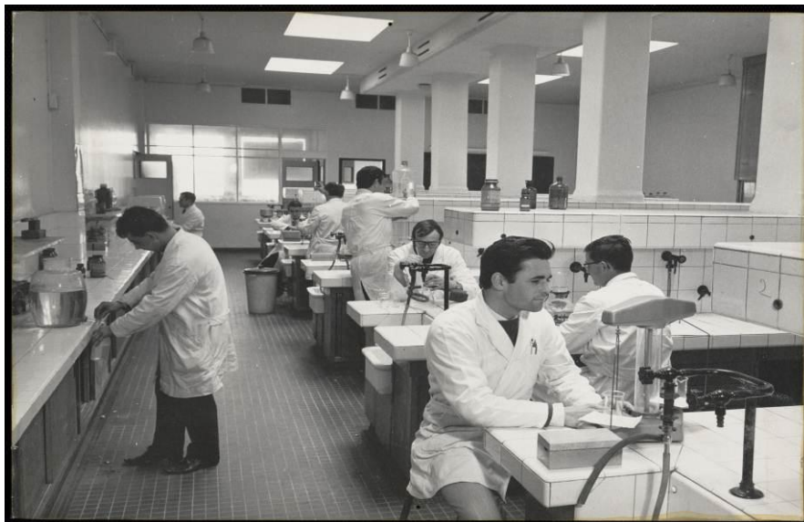
Un laboratoire de la faculté des sciences